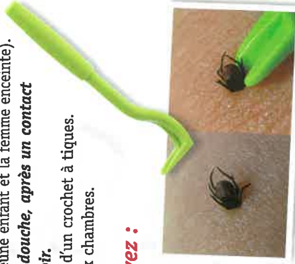
Glisser le crochet à tique entre la peau et la tique puis tirer doucement en tournant.

Enfin, il est souhaitable de détruire la tique, si possible, en l'enveloppant dans un papier avant de la brûler.